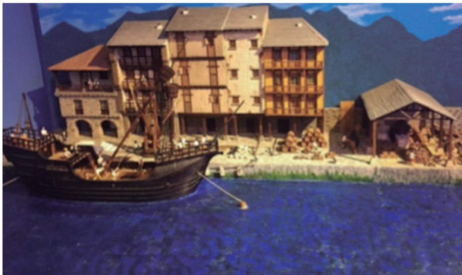
Construcción de la Nao Victoria en el puerto de Zarauz

La Asociación Navarra de Modelismo Naval, se fundó en el año 1987. Es una asociación sin ánimo de lucro y nos dedicamos a la difusión de todo lo relacionado con la navegación y su historia. Desde el inicio hemos realizado diversas exposiciones, la primera en el año de su fundación 1987. Al año siguiente expusimos en la ciudadela, donde se han inaugurado cada una de las XI muestras. Luego se han llevado y expuesto a lo largo de buena parte de la geografía nacional e incluso en Francia hasta en 65 ocasiones. En el año 1992 con el 500 aniversario del descubrimiento de América, realizamos nuestra primera exposición temática que estaba basada en los descubrimientos, en la que expusimos 53 maquetas nuestras y 26 más de asociaciones invitadas. Desde ésta hemos realizado VIII muestras temáticas más, con diversos argumentos como Piratas y corsarios (1995), De Lepanto a Cuba (1998), los Naufragios (2001), Carpinteros o Magos (2004), El oro de las indias (2007), Marineros y Exploradores (2010), El Dominio de los Mares (2016); y la última que hemos realizado, "Primus Circumdedisti Me", se inauguró el año 2020 en el palacio de Condestable, y la tenemos en la actualidad en el Planetario de Pamplona. Estará expuesta hasta el próximo día 5 de septiembre, en horario del Planetario y entrada libre.