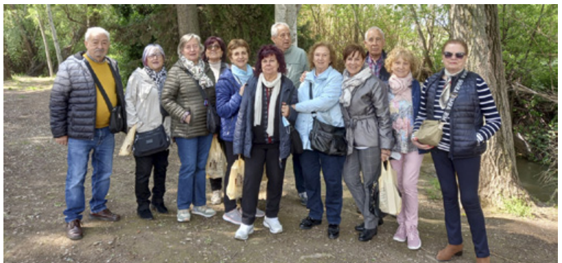
Monasterio de Tulebras