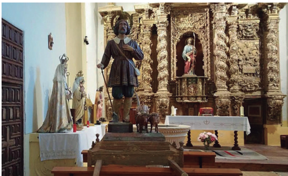
Arenillas de Valderaduey

He tenido la curiosidad de estudiar e indagar la historia de Arenillas. He de decir que no son muy abundantes los datos históricos que he podido recabar, pero que hay hitos muy interesantes que a los hijos del pueblo si les han de interesar.