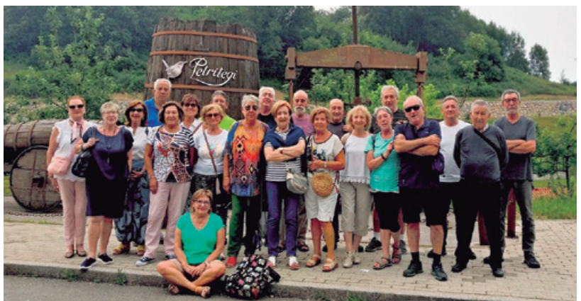
Excursión de sidrería