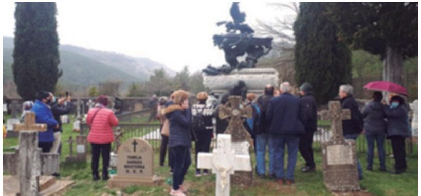
Mausoleo de Julián Gayarre, Roncal

El día 14 de junio se realizó la "excursión de sidrería". Esta ya es un clásico de Grumatena para el mes de Junio. Aunque estos años anteriores no se pudo realizar por causa del COVID. Este año los 24 socios y socias que nos reunimos para el evento viajamos hasta el puerto de Pasajes en Guipúzcoa. Los más atrevidos nos pusimos en marcha para hacer la travesía por el monte hasta Donostia. Tuvimos un día estupendo, con unas vistas maravillosas y, además nos libramos de un día de la ola de calor que afectaba mucho más a Pamplona. Tras juntarnos con los menos andarines allí, el autobús nos llevó a la sidrería Petritegui de Astigarraga para degustar un típico menú de sidrería. Y tras la sobremesa amenizada por nostálgicos cánticos regresamos a Pamplona a última hora de la tarde y al asfixiante calor que hacía pasadas las 8 de la tarde.