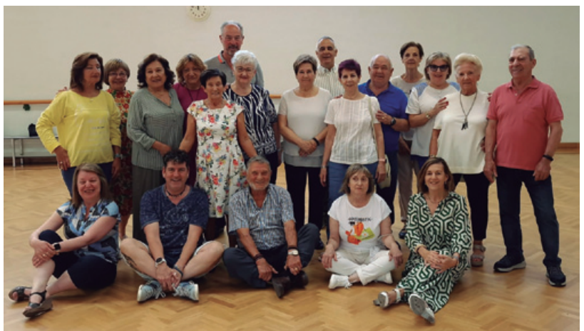
Algunos participantes en el curso de baile